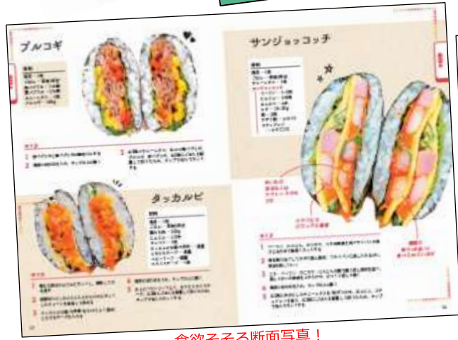
食欲そそる断面写真！