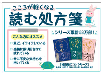
↑ 読む処方箋A4パネル